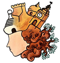
"MittAffett" Associazione Culturale