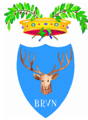
Provincia di Brindisi